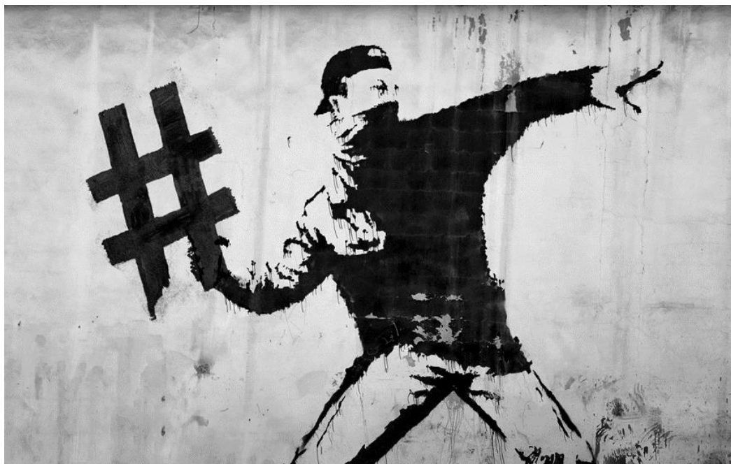
El poder del hastag

https://www.xlsemanal.com/conocer/tecnologia/20180913/feminismo-hashtag-redes-sociales.html , Foto: Cordon Press, 13.09.2018.